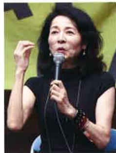
GUEST [女優] 木内 みどり さん

目指すべき未来は、持続可能で次世代に押し付ける負担が最も少なくなる(と思われる)選択をすること。そこに意を異にする国民はそう多くないはずなのに、我々は今も二極化したグループの中で対立しあう構図(保守とリベラルや、賛成派と反対派などもそうです)から抜け出せずにいます。ここからどう抜け出して、建設的な議論を進めることができるのか、そのヒントを探しに当日は参加させていただきます。ぜひ原発「脱原発派」ではない人も気軽に足を運んでください。歌を聴いてもらおうのにその人が何派かに関係ないですから。当日をとても楽しみにしています。