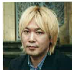
GUEST [ジャーナリスト] 津田 大介 さん

テレビ・映画・舞台でコミカルなキャラクターから重厚感あふれる役柄まで幅広く演じている。3・11以降、脱原発集会の司会や講演を引き受け積極的に活動。「マガジン9」でコラム連載、WEBラジオ「自由なラジオ」ではパーソナリティとして出演もしている。昨年毎日1枚Twitter上に載せた絵365枚を本にまとめて出版予定。