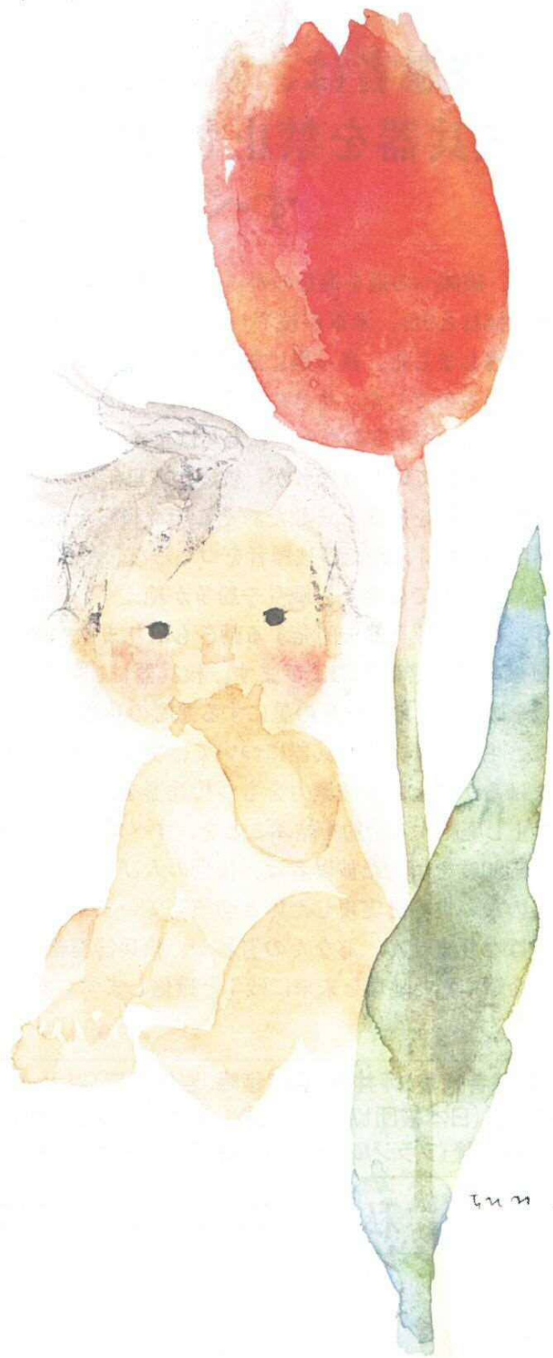
いわさきちひろ チューリップとあかちゃん (1971年)